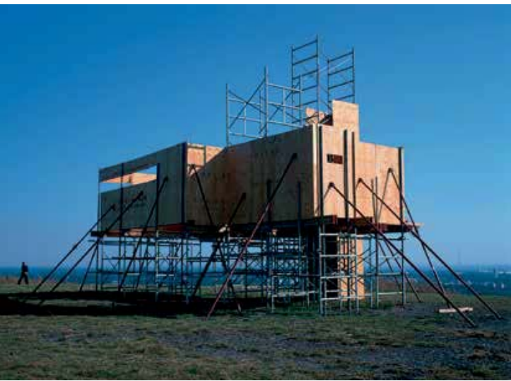
Virginie Bailly, Point de vue, installatie op de terril van Winterslag, Genk, steigers, en OSB-hout, 600 x 600 x 900 cm

Deze lente loopt in Kunstencentrum De Garage in Mechelen de tentoonstelling Le Mont Analogie van Virginie Bailly. Ook die heeft het meervoudig gezichtsveld als thema en punt van reflectie.