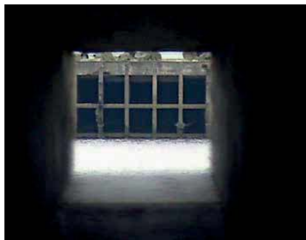
Virginie Bailly (in samenwerking met Dominique Leroy), Dérives-Ontdubbeling , 2010, installatie Nantes (FR), steigers, OSB-hout fibreboard, zwarte verf en sound scape, 80 x 220 x 1700 cm

Dominique Leroy (°1970). Ook hier creëert ze een kijkdoos, een 17m-lange tunnel in OSB-hout en gevat in een steigerinstallatie. “Steigers geven aan een constructie iets tijdelijks, iets efemeers.” Binnenin is de tunnel helemaal zwart geschilderd, de vloer loopt op, de zoldering loopt neerwaarts en ook de wanden naderen elkaar. Op het einde is er een kleine opening. Wie de wat claustrofobische drempel overwint en zich in de tunnel waagt, wordt uiteindelijk beloont met een zicht op de overkant van het water. Ze heeft de tunnel immers gebouwd aan de oever van de Loire, in een groen gebied. Door de kadrering zie je enkel de onderkant van de stad, de betonnen pijlers waarmee de oevers en de kade zijn versterkt. Het zicht wijzigt ook voortdurend want de rivier heeft een getijdenwerking, de verandering wordt in beeld gebracht. Dominique Leroy zorgde voor een soundscape, veroorzaakt door de trillingen van het water, “het geluid was als van een ademende walvis.” Ze bezorgt de belangstellenden een totaalervaring.