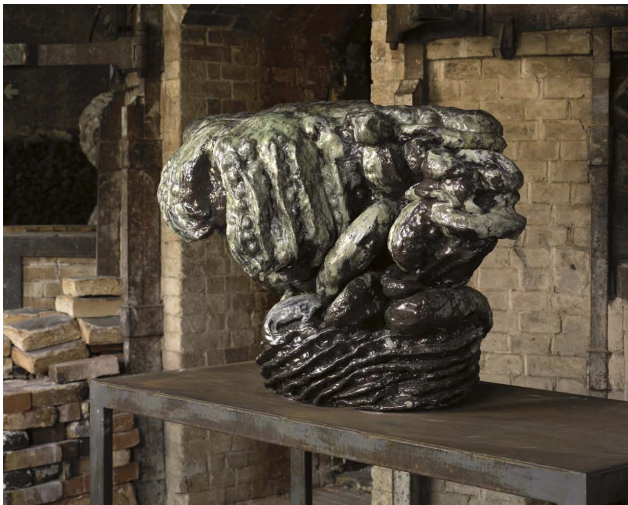
1- "Les Amants, Les Poulpes" 2006/2007, grès chamotté, 58 x 72 x 53 cm · 2- "Les Amants, Eléphant" 2005/2007, grès chamotté, 58 x 92 x 65 cm