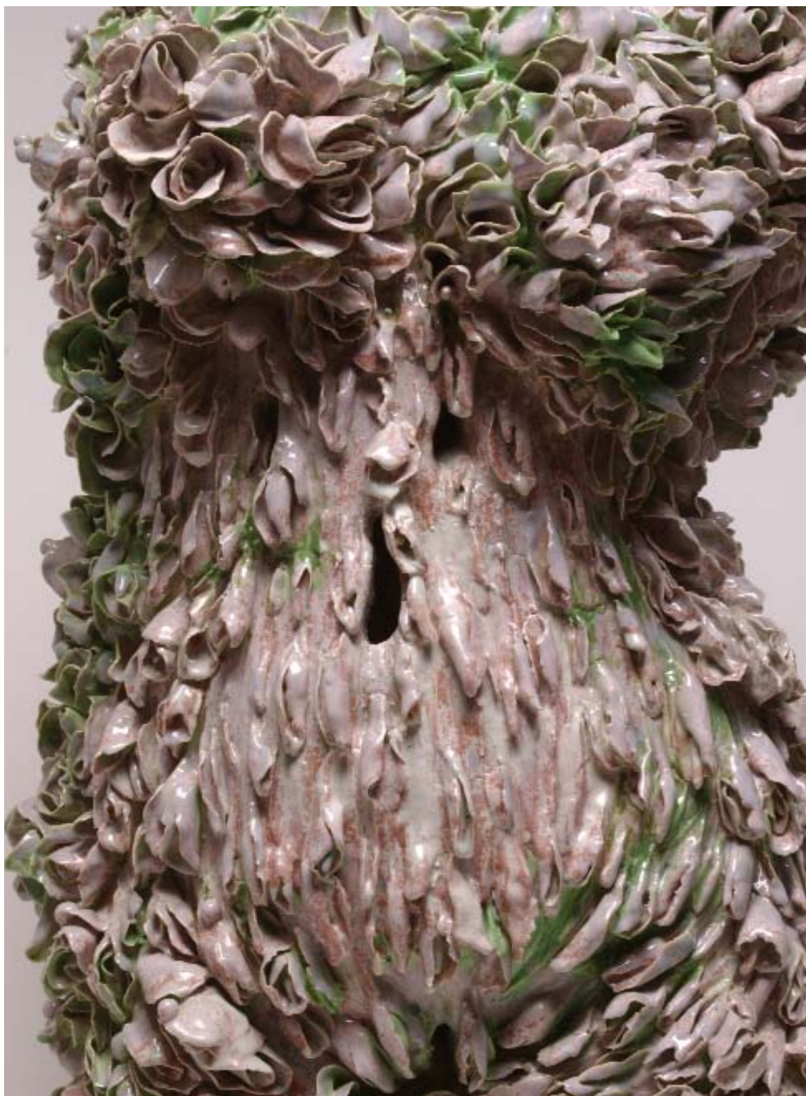
9- Détail "Odore di Femmina de Sèvres" 2006, porcelaine chamotté, émail vert et rose, cristallisations, 93 x 55 x 34 cm