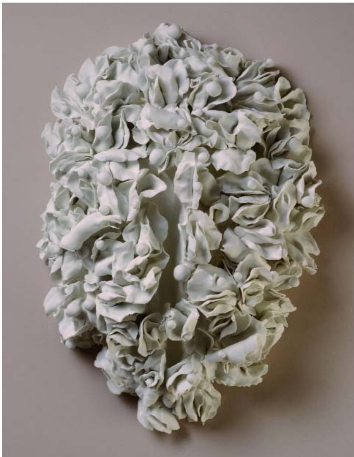
10- "La Vulve" 2005, biscuit de porcelaine de Sèvres, 37 x 27 x 14 cm